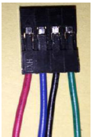
Figura 2 - Sequenza cavi come da schema generale

NicolaP subito dopo lo schema generale della Figura 1 , riporta di ricablare il connettore Dupont a 4 poli come nell'immagine sotto (Figura 3) dove il nero ed il verde sono invertiti rispetto allo schema generale della Figura 1 e della Figura 2 . Qual è quindi la sequenza corretta, Figura 2 o Figura 3???? Che sia questa l'origine dei miei mali?